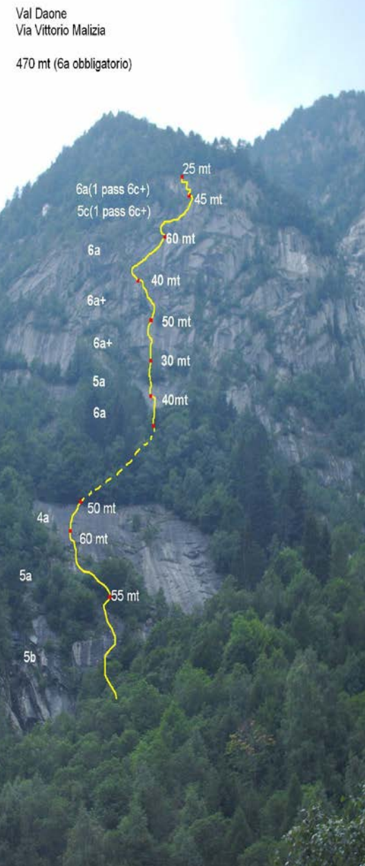
Val Daone Via Vittorio Malizia 470 mt (6a obbligatorio)