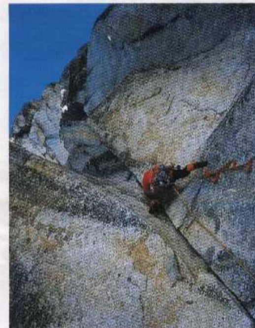
Sul 5° tiro del Giorno degli Araucani

Accesso: dal rifugio Prudenzini seguire il sentiero per il passo Salarno fino al primo Tornante verso dx. Lasciarlo e puntare alla base dell'evidente canale (c.a. 100 mt) da dove si scorge tutta la parete. Risalirlo fino al suo termine (200 mt II°). H. 2.00.