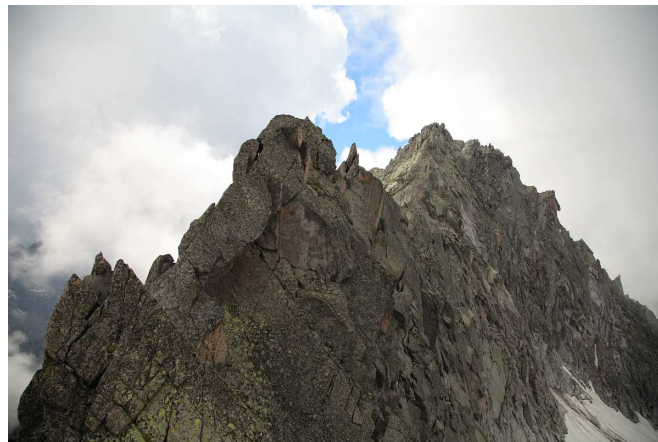
La cresta N-E di Cima Prudenzini come appare dalla Bocchetta del Remulo