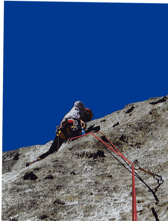
“Bibo Damioli” in arrampicata sulla splendida roccia della Val di Leno.

per le soste e si consiglia l'uso di due corde da 50 m. Il rientro avviene in doppia lungo la via. Bella arrampicata su placca solare di bassa difficoltà con grossi funghi nella prima parte più verticale e piccole prese nella seconda appoggiata (aderenza). La salita è interamente protetta a spit da 8 mm, unico modo di chiodatura su queste placche senza l'ombra di una fessura. Sono presenti 8 spit e 2 chiodi soste comprese (sviluppo 90 metri+15 non protetti, diff. Max. 5a). L'at-